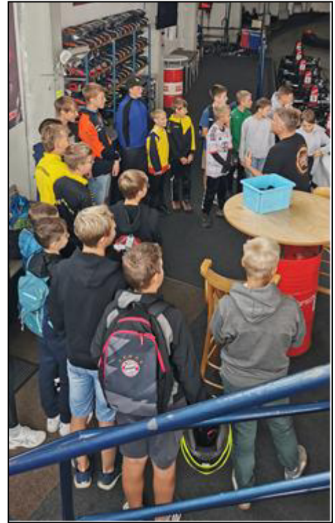
Winterzauber am 13.12.2025 am Sportplatz Pittenhart / Bastelangebot und Spiele für Kinder und Jugendliche